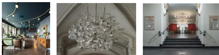
Foto lånade från hemsidan www.orsjo.com och visar exempel på utförda belysningsarbeten. Från vänster Stora Hotellet, Nybro (!), Nationalmuseet samt Konserthuset i Stockholm

Först till Örsjö Belysning - ett ledande drygt 70-årigt belysningsföretag, med flera kända designers knutna till sig. Förmiddagsfika med presentation, därefter visning av såväl produkter som tillverkning.