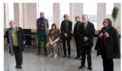
Några av oss som lyssnar intresserat