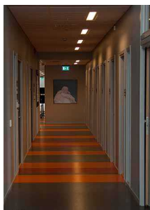
Korridor i personalavdelningen samt stolar i personalrummet