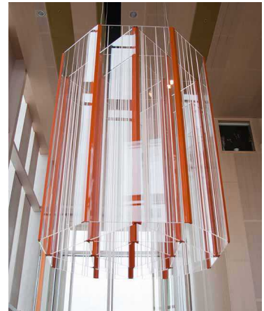
Armatur Ingegerd Råman & Fagerhults i Habo