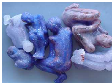
Gjutna skulpturer av Helena Blom